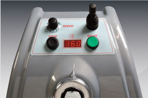
SF500VD Pannello comandi con velocità variabile Control panel with variable speed