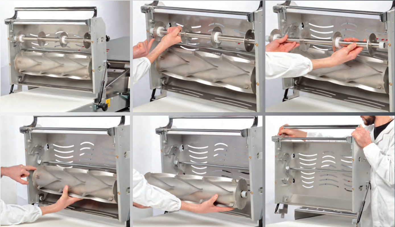
ST600 _ OPTIONAL - OPTIONAL - EN OPTION - OPCIONAL - OPCIONAL - ОПЦИИ