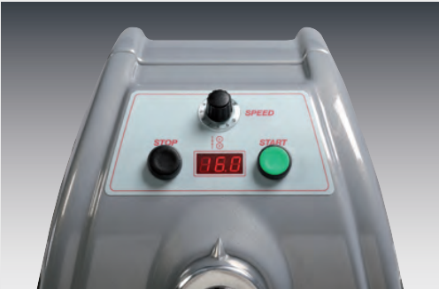
SF600VD Pannello comandi con velocità variabile Control panel with variable speed

Sfogliatrici da pavimento _ Floor dough sheeters _ Laminoirs à poser au sol Laminadoras de masa para el suelo _ Тестораскаточные Машины Напольные