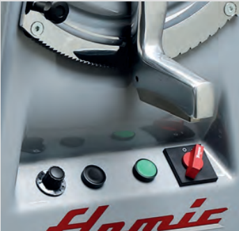
SF450VD Pannello comandi con velocità variabile Control panel with variable speed